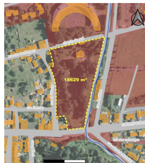
Propriété Weber, Bazeilles, vue aérienne, DUMAY

Le marché pour la réalisation d'un inventaire des zones humides du territoire d'Ardenne Métropole a été notifié. L'inventaire va pouvoir débiter.