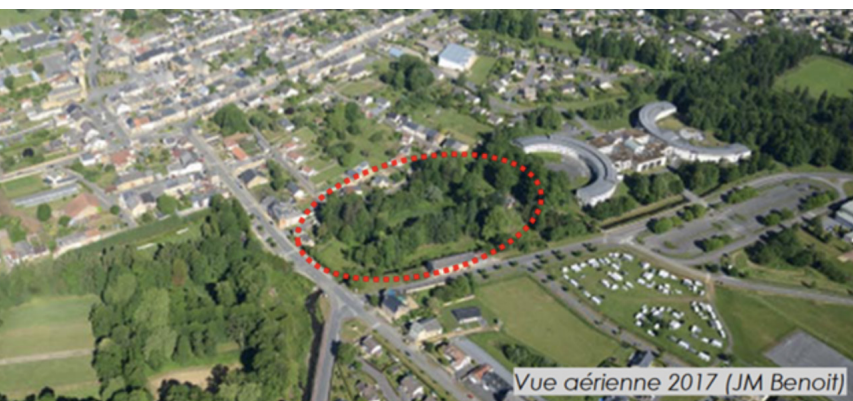
Propriété Weber, Bazeilles, vue aérienne, DUMAY